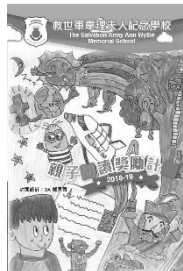
初級組冠軍 鄭匡晉(本年度 4A 班)