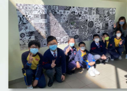
組員合力將六年級同學「點、線、面」 畫作合作拼砌成大型特色作品

本活動小組透過參與「賽馬會油蔴地樂校園藝術計劃」與藝術家接觸，共同創作大型校園壁畫，為校園添上新姿彩。