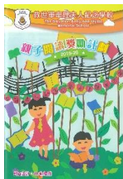
初級組冠軍 (本年度 4B 班 郭縉濤)