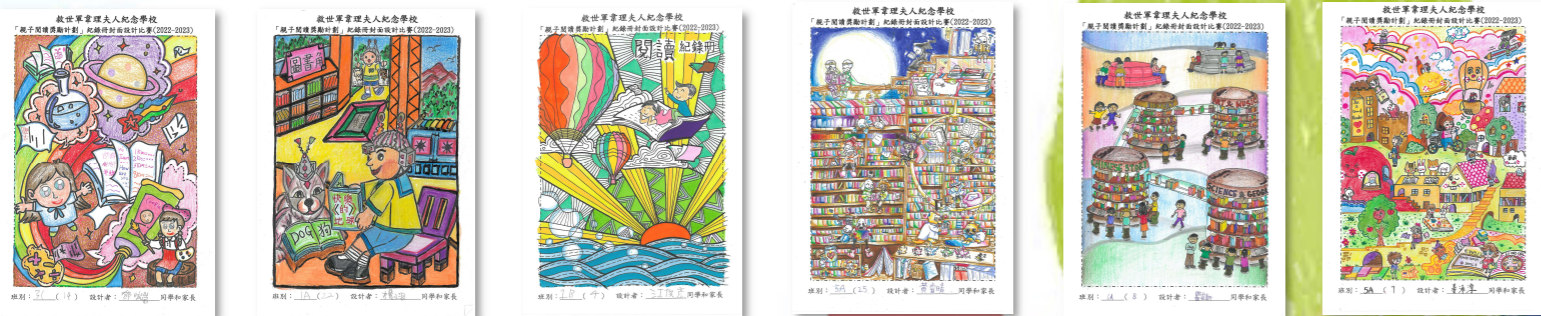
初小組冠軍 3A 鄧曉嵐 初小組亞軍 1A 楊翊 初小組季軍 1B 江俊彥 高小組冠軍 5A 黃睿晴 高小組亞軍 6A 瞿睿軒 高小組季軍 5A 姜滄淳

早前，學校舉辦了「親子閱讀獎勵計劃」紀錄冊封面設計比賽，目的是讓家長與子女一起發揮創意，一同設計閱讀冊封面。是次活動反應踴躍，參加人數多不勝數，其中6A班全班同學均參與，獲得「最積極參與獎」。是次參賽作品均十分優秀，經過校長、視藝科科主任及圖書科老師評審後，最終由3C 鄧曉嵐及5A 黃睿晴分別獲得初小組及高小組的冠軍。初小組及高小組冠軍作品將會印製作閱讀冊封面，而其他得獎作品，將印刷在封底。與此同時，為慶祝35周年校慶，優秀作品將有機會印製成精美的書籤，作為校慶紀念品之用。學校再次感謝家長及同學的熱心參與，有你們的支持，活動顯得更有意義！